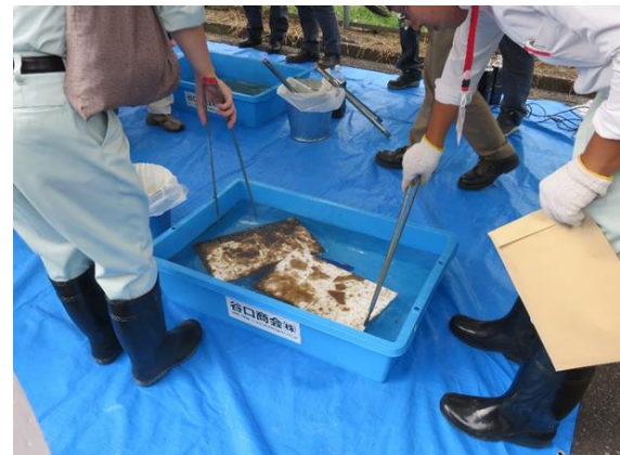
吸着マットの性能確認