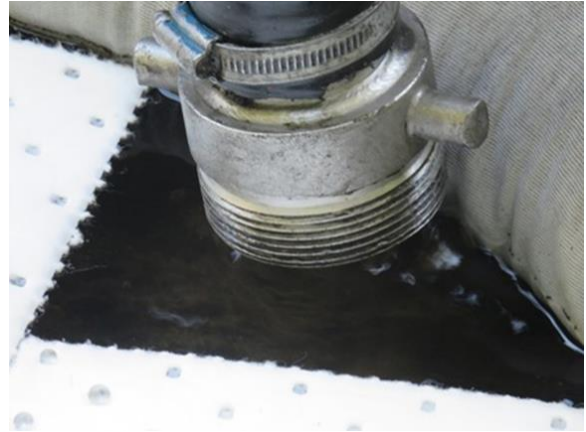
吸引車での油吸引実演