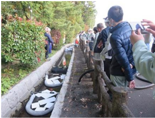
吸着型オイルフェンスの設置と吸引車による油回収