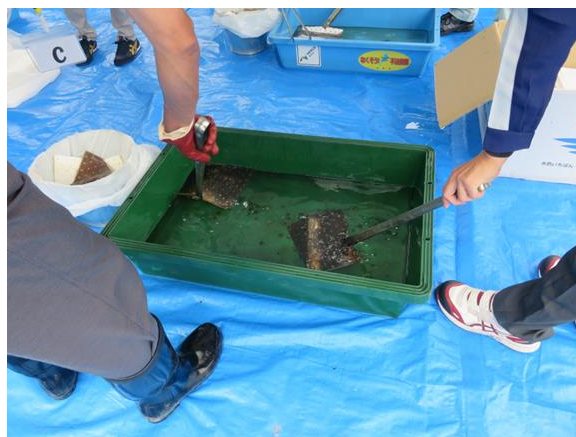
吸着マットの性能確認