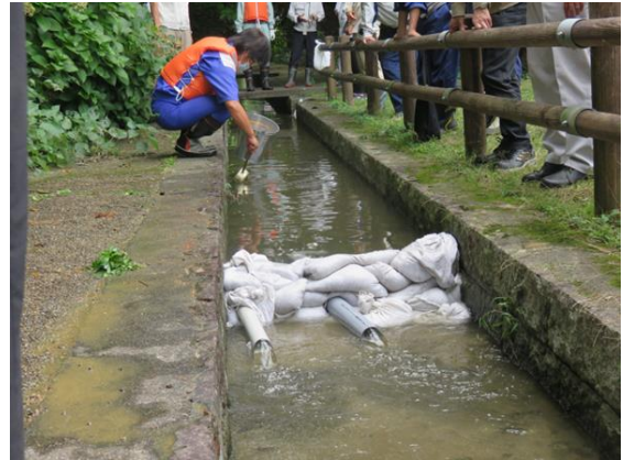
柄杓による油回収作業