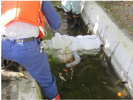
土嚢による堰止め

油流出想定訓練として事業所での油流出事故があり、一部河川に油が流出したとの想定で実施。