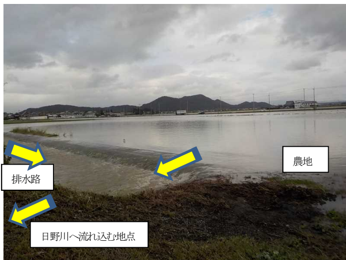
冠水した農地から、河川へつながる水路へ水が流れる様子（冠水当日午後） H29.10.23 14:23

近年、日本各地で、これまでの想定を超える自然の猛威に見舞われることが増えてきています。滋賀県でも、平成29年の超大型の台風21号により、東近江市にある観測所で日降水量が観測史上