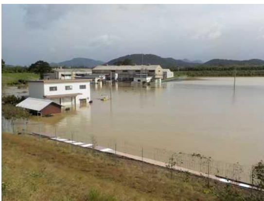
農地、集落、工場等が水没 H29.10.23

また、油を使用していた工場も水没したため、工場内の油槽の油が付近一帯（約40ha）に流出し、日野川から琵琶湖まで流れるという事案が発生しました。