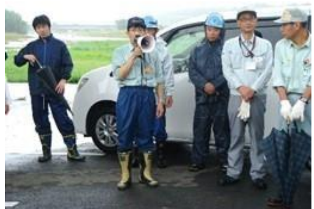
午後：南部環境事務所川部副参事