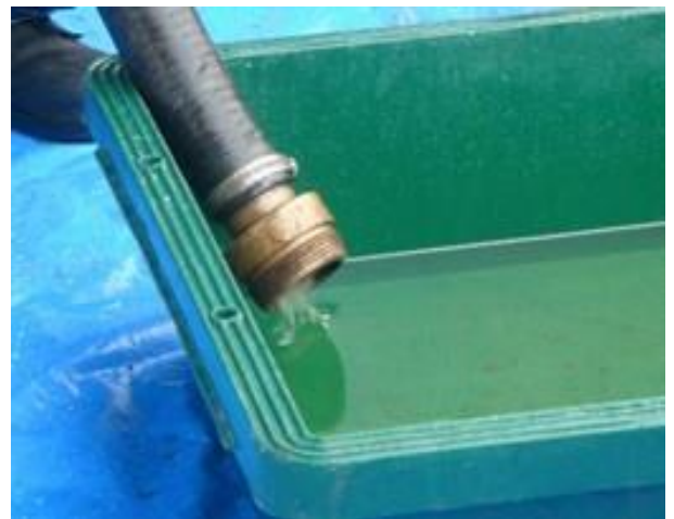
吸引車での油吸引実演