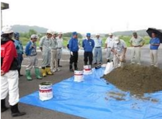
土嚢づくりレクチャー