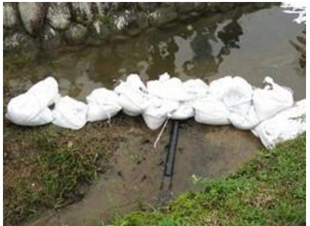
パイプを用いて土嚢底部の水路確保