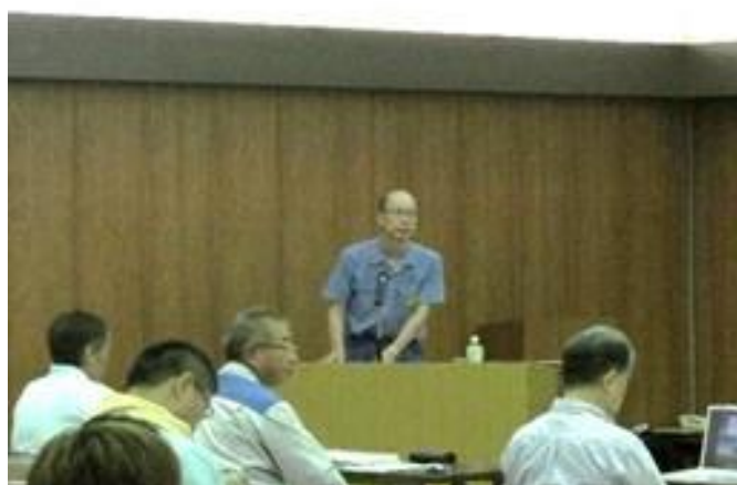
【午前】 甲賀地区 物部地区懇副部会長