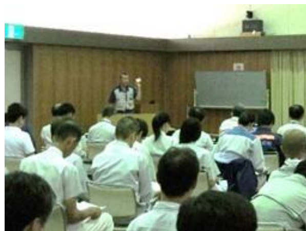
【午後】 南部地区 中尾地区懇部会長